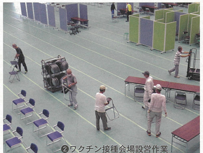
② ワクチン接種会場設営作業

現代の文化社会の恩恵には大きなものがありますが、そこに伴う負担も少なくありません。技術向上により、どんどん多機能になっていく携帯電話や車に必要な出費。毎月の生活費や家族（孫）へ