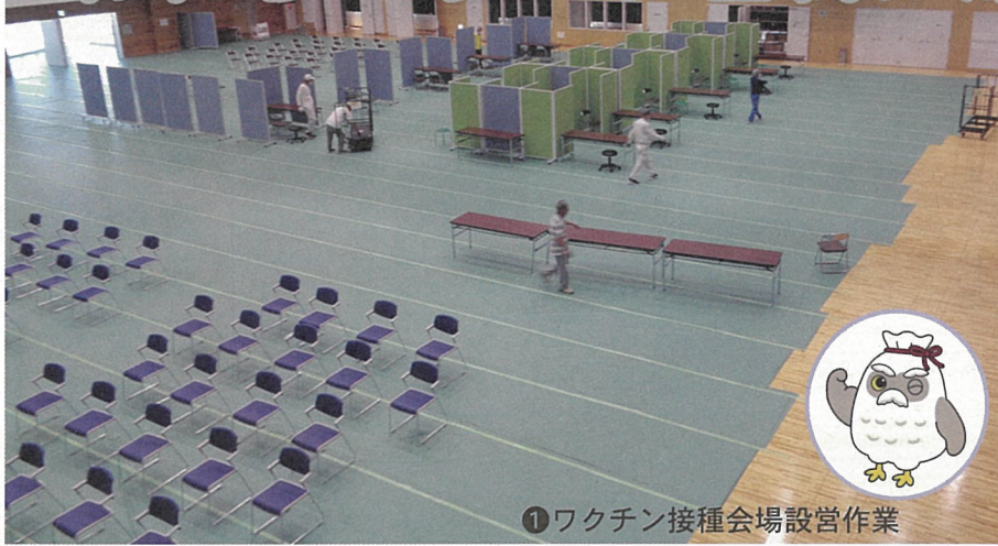
① ワクチン接種会場設営作業