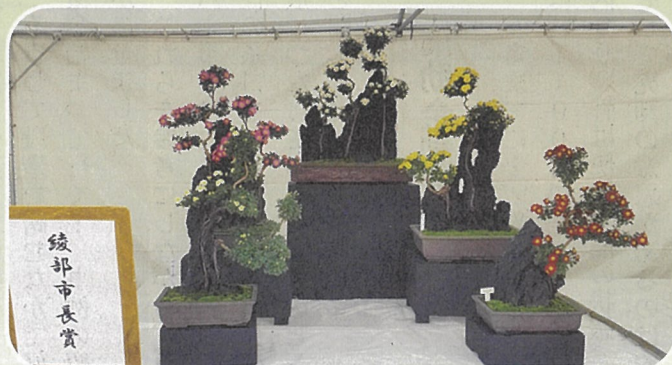
市長賞 福井哲夫 様の作品