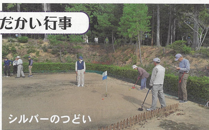
シルバーのつどい