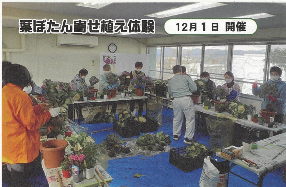
寄せ植え体験で制作した作品は、葉ぼたん展「創作の部」で展示しました。