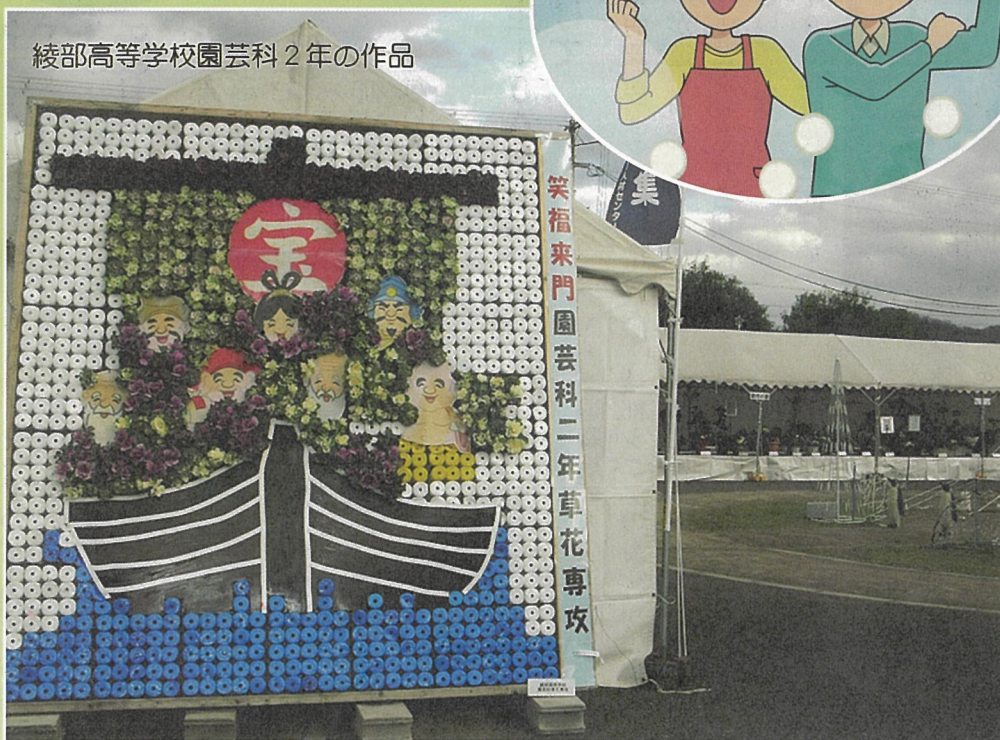
綾部高等学校園芸科2年の作品