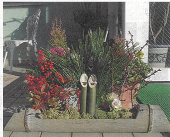
毎年、楽しみにしておられる参加者もいらっしゃる講座です。今年も素敵な三門松が完成しました。

が改修する際の費用の補助金制度があるので、是非、利用して欲しいという説明がありました。 この空き家管理や家財整理もシルバーの仕事として生きています。 タイアップ 又、農村地域においては集落同志のさらなる連携を高めてゆく取り組みも要