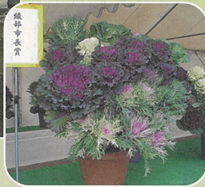
市長賞 森智愛 様の作品